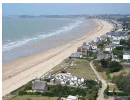
Littoral urbanisé de Carolles à Jullouville

La ville d'Avranches a une emprise urbaine réduite mais l'espace périurbain est éclaté, mettant en avant des effets de mitage. Au nord et à l'ouest, les petits bourgs connaissent un développement mal maîtrisé : Marcey-les-Grèves, Saint-Jean-de-la-Haize, Ponts, Vains, Le Val-Saint-Père. Le développement urbain de ces communes se fait le long des petites routes de campagne.