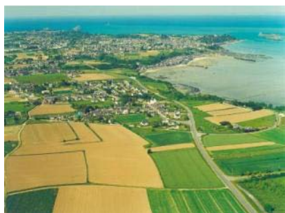
Bande littorale de Cancale à St-Meloir

- Une dynamique de construction neuve modérée sur Avranches qui s'accompagne d'une urbanisation plus ou moins diffuse le long de l'axe de l'A84 de Villedieu-les-Poêles à Saint-James.