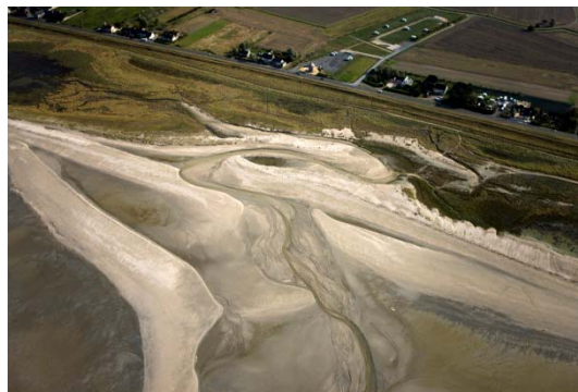
Cordons coquilliers sur Hirel

La tange a longtemps été utilisée comme engrais et amendement pour l'agriculture. Les quantités enlevées annuellement étaient considérables et les écrits anciens parlent de milliers, voire de dizaines de milliers, d'attelages utilisés pour enlever les précieux engrais à la mer (Lefèvre et al. , 2002). L'âge d'or de l'exploitation de la tange peut être situé entre la fin du 18 ème et le milieu du 19 ème siècle.